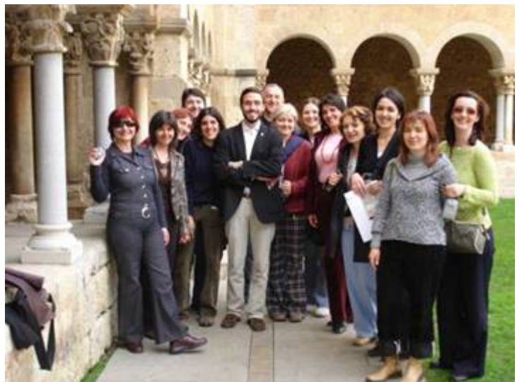
Estades de mestres de BiH, 2006 al monestir de Sant Cugat