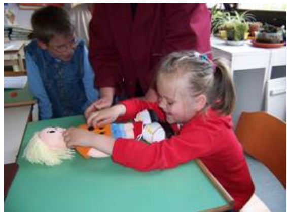
Sarajevo, a Bòsnia i Hercegovina, així

Mitjançant aquest article desitgem relatar el desenvolupament del projecte d'integració de joves amb disminució visual en el sistema educatiu ordinari a la ciutat de